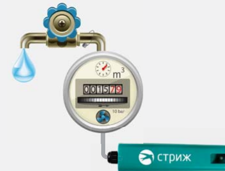
Модем Стриж установлен