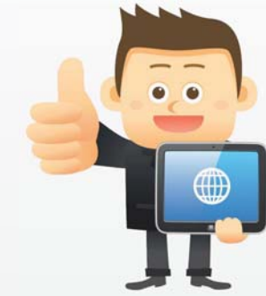
Договор на интернет и телевидение заключен