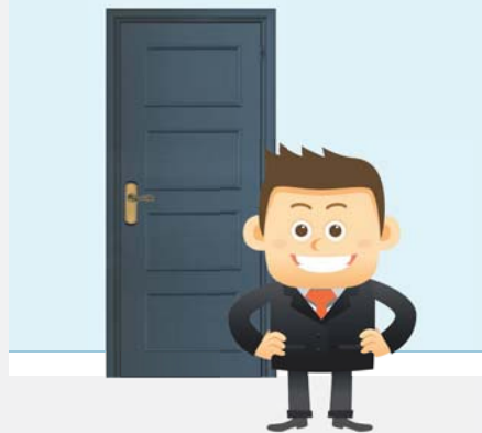
Металлическая входная дверь установлена