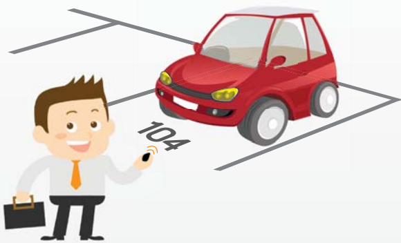
Договор на парковку подписан