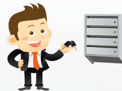
Ключ от почтового ящика получен