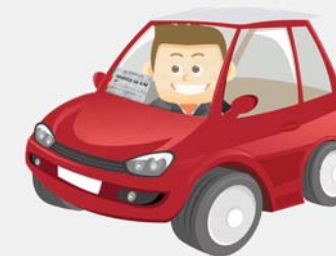
Заявка на временный проезд на территорию оформлена