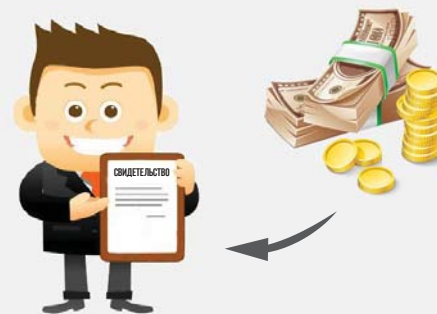
Свидетельство о собственности получено, получить налоговый вычет