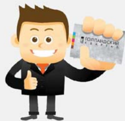
Постоянный пропуск собственником получен