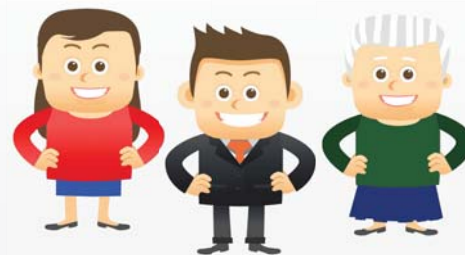
Заявка на дополнительные пропуска оформлена